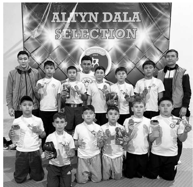
Алакөлдің атын әйгілеп турнирде атой салып, қоржынға жүрген жекпе-жекшілер тағы бір 11 медаль салды.

Әмбебап спортшылар қай турнирде де қарсылас шыдатпай, тұғыр биігінен көрініп жүр. Бүгінде талай әлем чемпионы шыққан залдан жеңіс дәстүрінің үзбей жалғайтын жасөспірімдер де өсіп келеді. Соның нәтижесі Алматыда өткен турнир болды. Сақадай сай барған спортшыларымыздың шашасына шаң жұқпай, аудан атын тағы бір мәрте үстем етті.